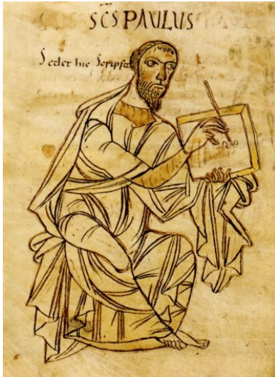
Paulus in einer frühmittelalterlichen Buchmalerei (Kloster St. Gallen)

Der Apostel Paulus war jemand, der anders war oder wurde. Nach seiner Erleuchtung auf dem Weg nach Damaskus bekam er neue Einsichten. Es muss Gottes Wille gewesen sein, der ihn eine andere Haltung einnehmen ließ. Als Bürger von Tarsus besaß er seit seiner Geburt das Römische Bürgerrecht (Apg 21,39/22,28) und wurde Schüler des Rabbiners Gamaliel, der selber ein Befürworter der weniger strengen Gesetzesinterpretation war.