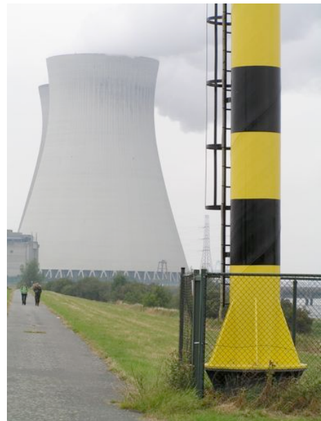
AKW Doel bei Antwerpen

Wir lassen uns zu oft manipulieren – wollen die Technik für unseren Komfort haben, obwohl wir wissen, dass dafür Energie benötigt wird. Woher soll sie kommen? Wir müssten einsehen, dass wir uns einschränken sollten. Jedoch scheinen wir nicht NEIN sagen zu können. Jede, jeder meint haben zu müssen, was die oder der andere auch hat. Doch es ist noch schlimmer. Man möchte vorn anstehen, das haben, was das Leben bequemer macht und womit gepunktet werden kann. Früher waren es die Bergleute, die ihr Leben einsetzten, um für andere die Kohlen zu fördern. Heute müssen alle, Energieverbraucher oder auch nicht, eventuell ihr Leben geben, wenn genug Energie zur Verfügung gestellt werden soll. Aber das will niemand wahr haben. Man schiebt den „Schwarzen Peter“ der Regierung