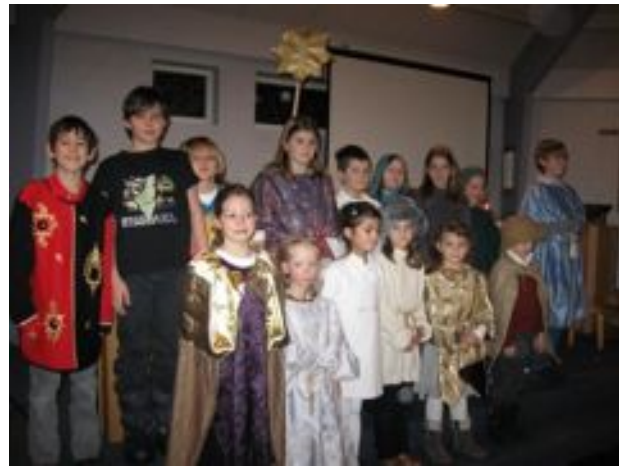
Krippenspieler in Antwerpen Heilig Abend 2010